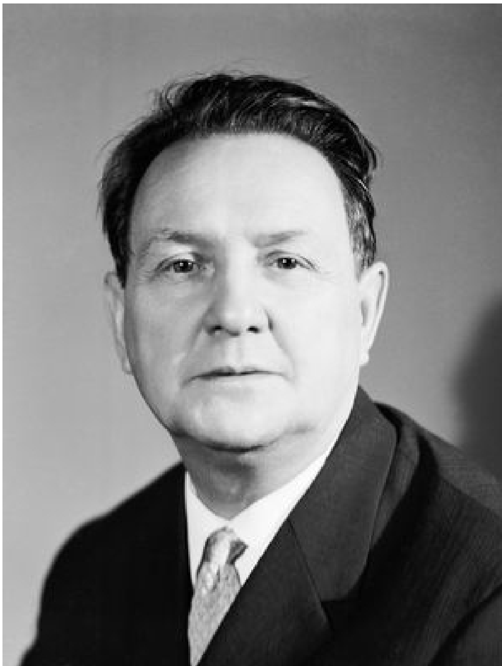
Марков Георгий Мокеевич 1911 – 1991