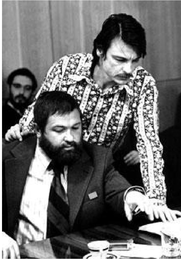
С Андреем Тарковским во время съёмок фильма «Солярис»