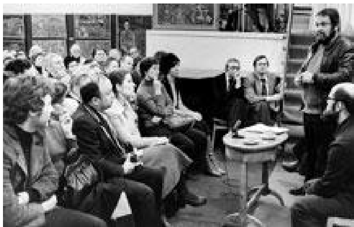
На встрече с читателями в Литературном институте. 1978 год