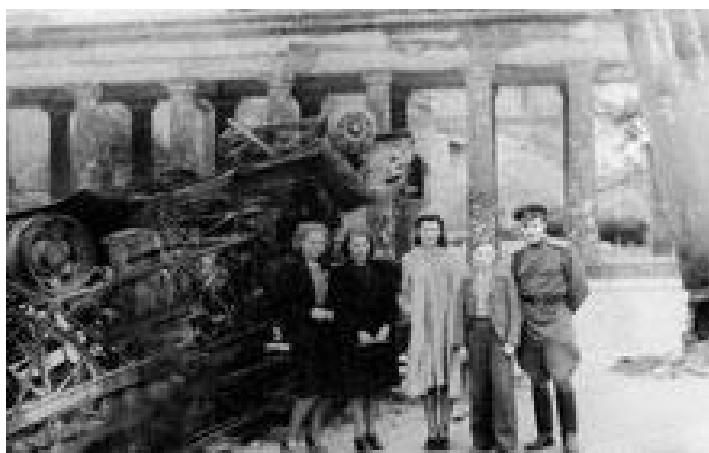
С отцом. Германия, июль 1945 года