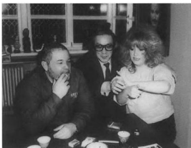
С Аллой Пугачевой 80-е годы