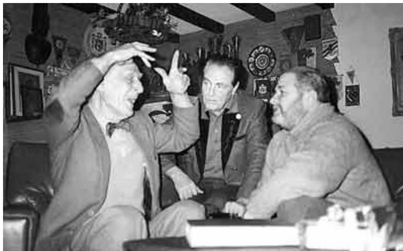
Юлиан Семенов, Федор Шаляпин и барон Фальц-Фейн, 70е гг.