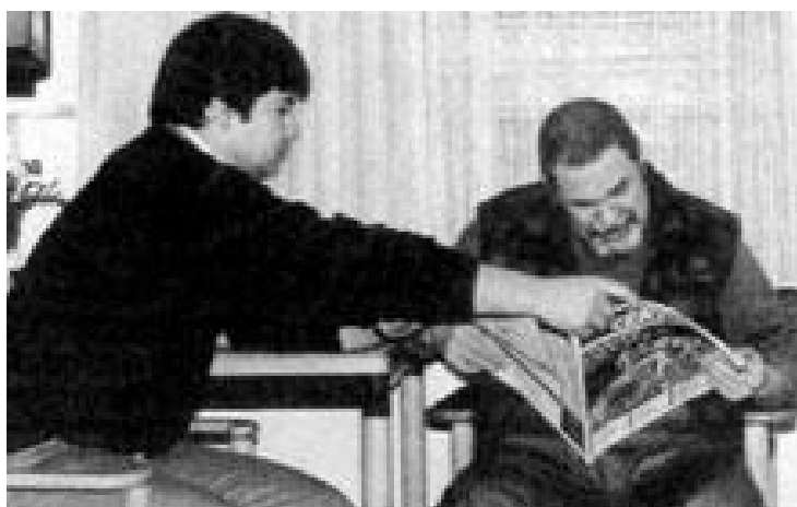
Артём Боровик и Юлиан Семёнов. Инсбрук, февраль 1991 года