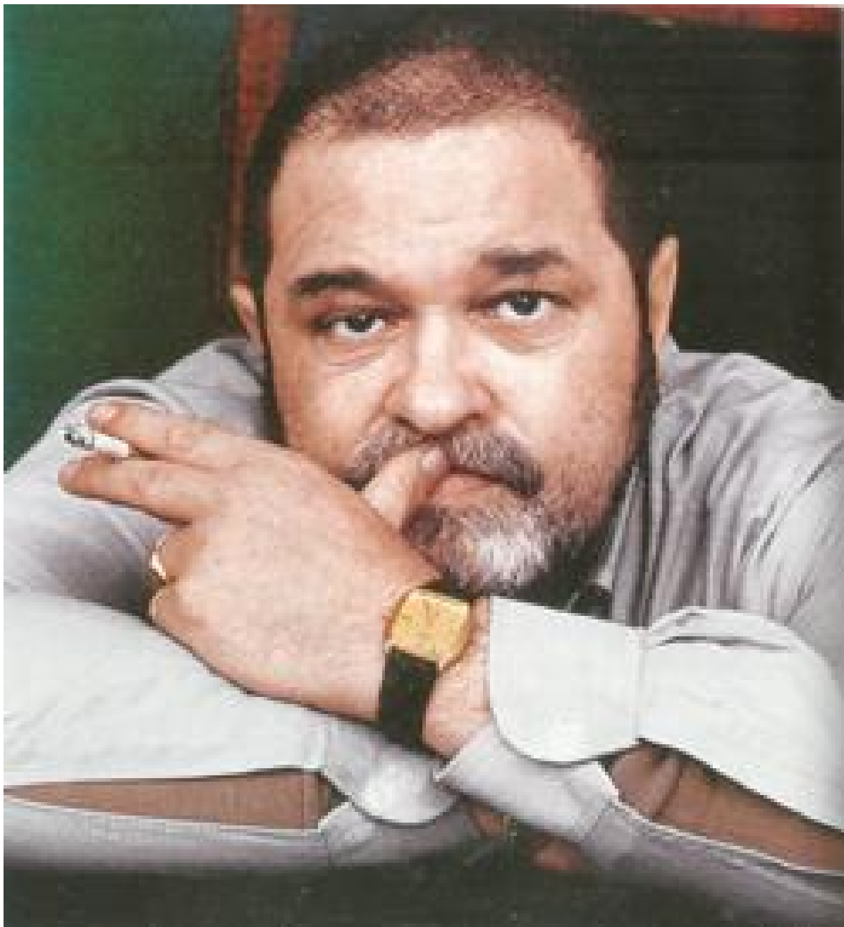
Семенов Юлиан Семенович (Ля́ндрес) 1931 - 1993