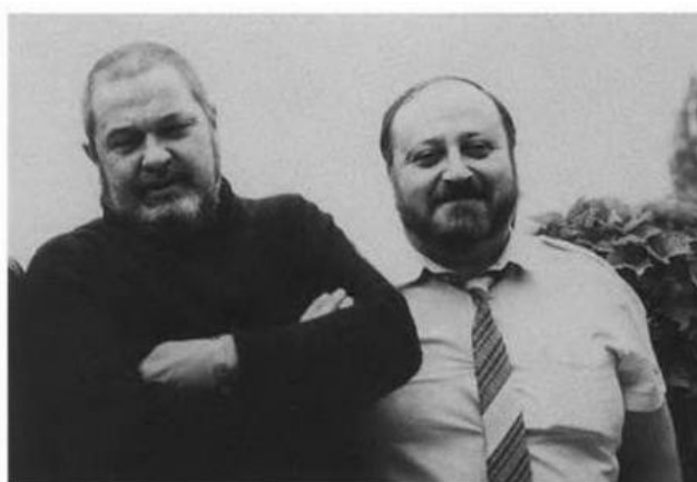
С писателем Георгием Вайнером