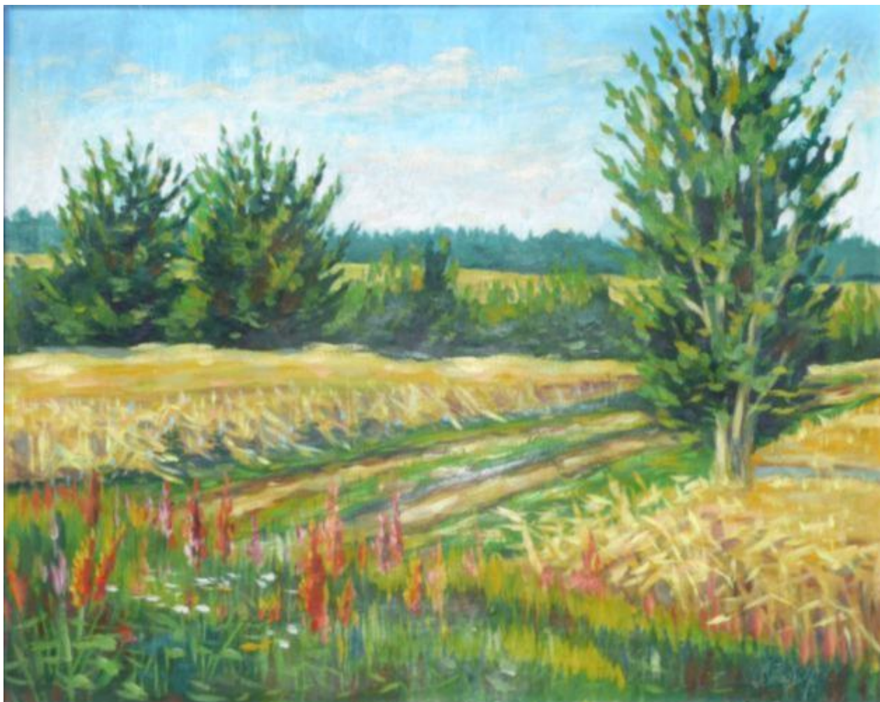
Этюд «Дорога», масло, 1985 г.