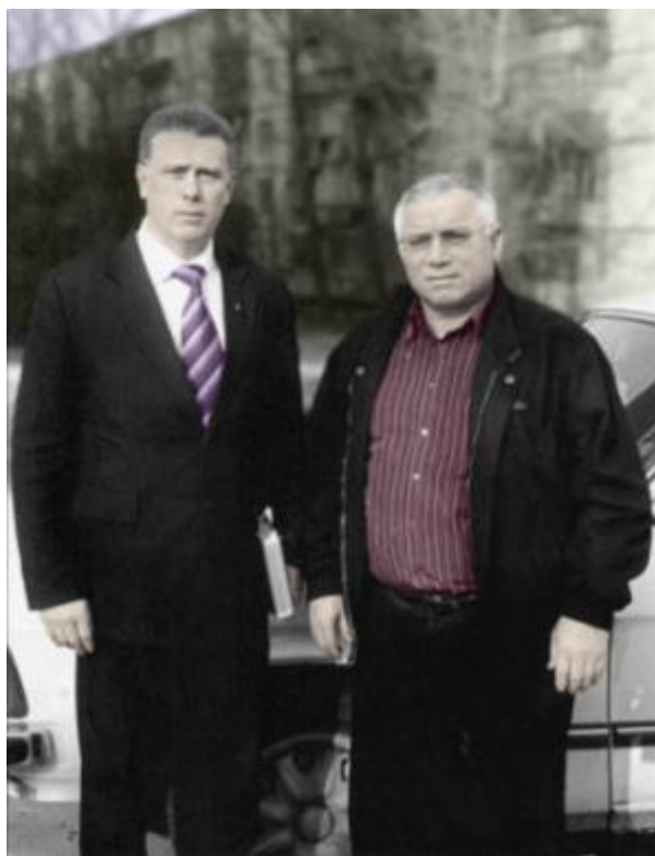
С Министром внутренних дел РФ генералом армии А.С. Куликовым