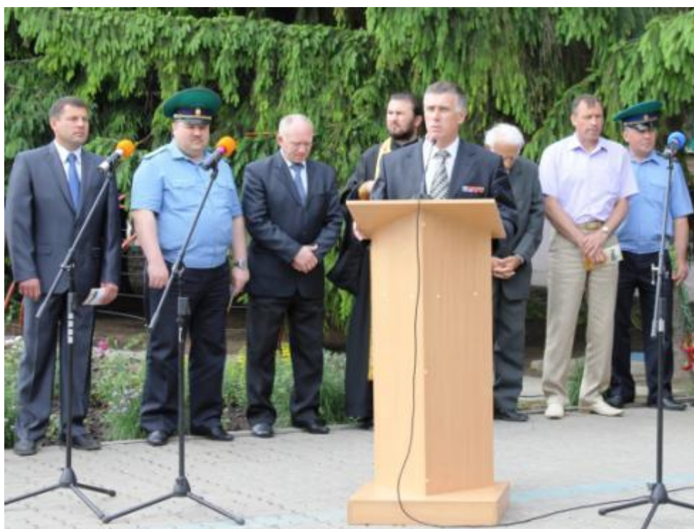
На открытии мемориальной доски в честь Героя Советского Союза К.Ф. Ветчинкина (Белгородская обл., с. Покровка, 2012 г.)