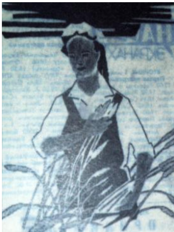
Девушка-хлебороб, графика Газета «Коммунист» от 5 мая 1981 г.