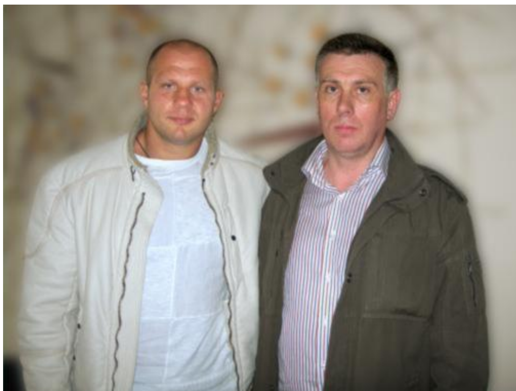
С легендарным бойцом смешанного стиля Федором Емельяненко