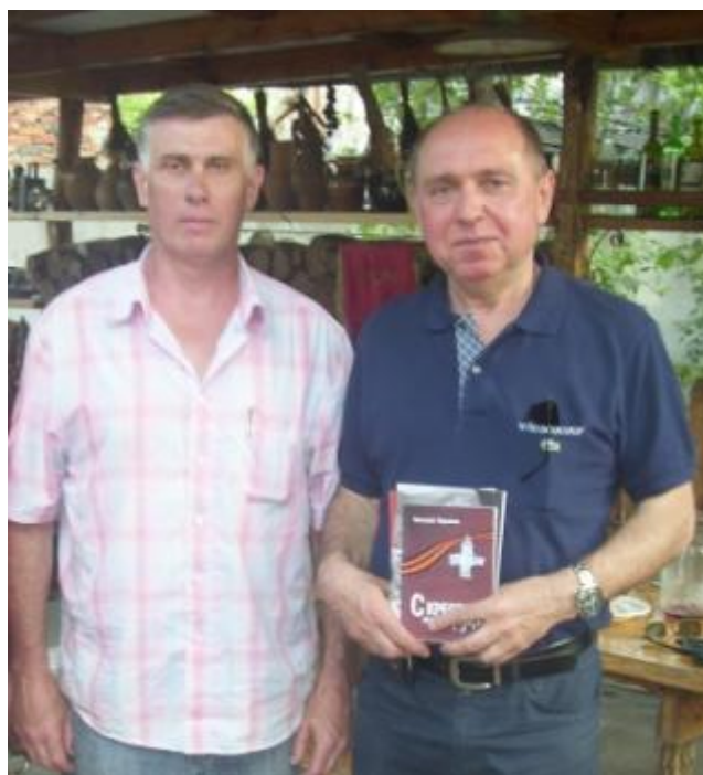
С Героем Советского Союза летчиком-космонавтом А.А. Волковым