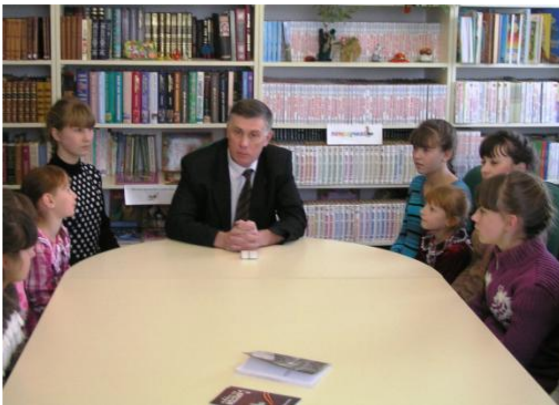
Патриотические чтения «Незримая связь поколений» с воспитанницами Прохоровского детского дома (п. Прохоровка, 4 февраля 2012 г.)