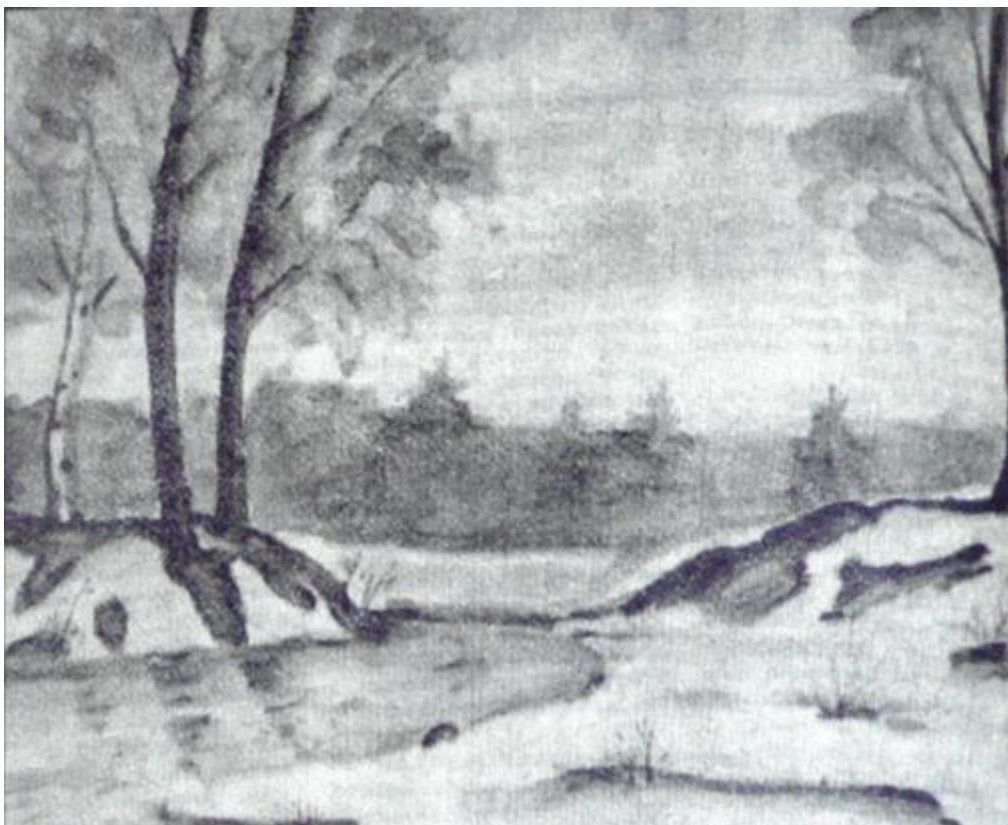
Ранняя весна, графика Газета «Коммунист» от 23 марта 1982 г.