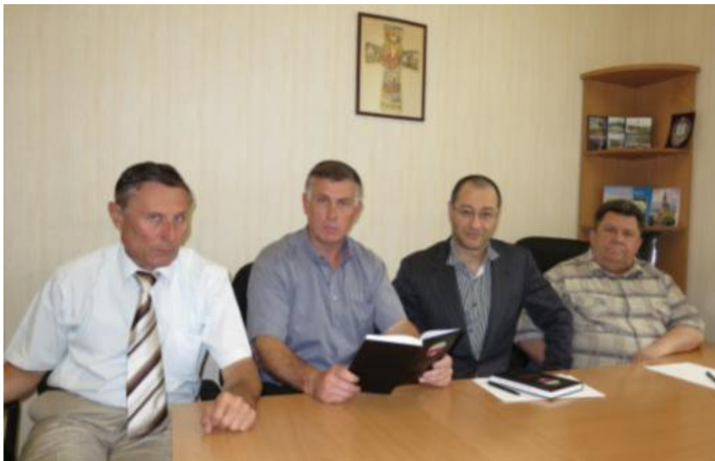
Встреча рабочей группы международного оргкомитета по организации и проведению торжественных мероприятий, посвященных 70-летию Танкового сражения под Прохоровкой, 70-летию освобождения от немецко-фашистских захватчиков г. Белгорода и г. Харькова, 70-летию образования Главного управления контрразведки «СМЕРШ» НКО СССР (г. Харьков, 28 мая 2012 г.)