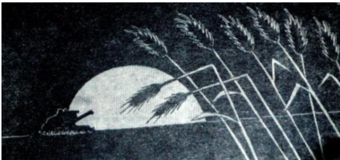
Жатва, графика Газета «Коммунист» от 17 марта 1981 г.