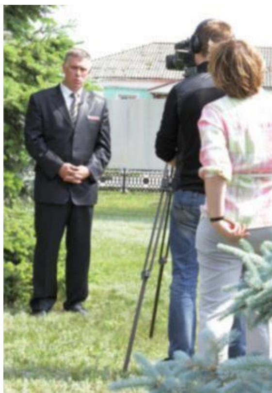
Во время съемок документального фильма «Начальник заставы» о легендарном пограничнике, Герое Советского Союза К.Ф. Ветчинкине