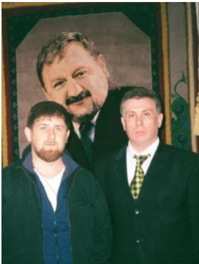
С Героем России Рамзаном Кадыровым