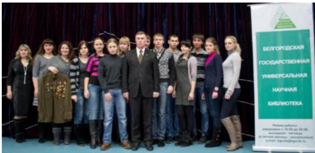
Со студентами Белгородского индустриального колледжа на творческом вечере, посвященном Дню защитника Отечества