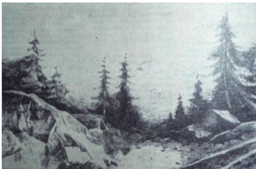
Там, где всходит солнце, графика Газета «Коммунист» от 13 апреля 1982 г.