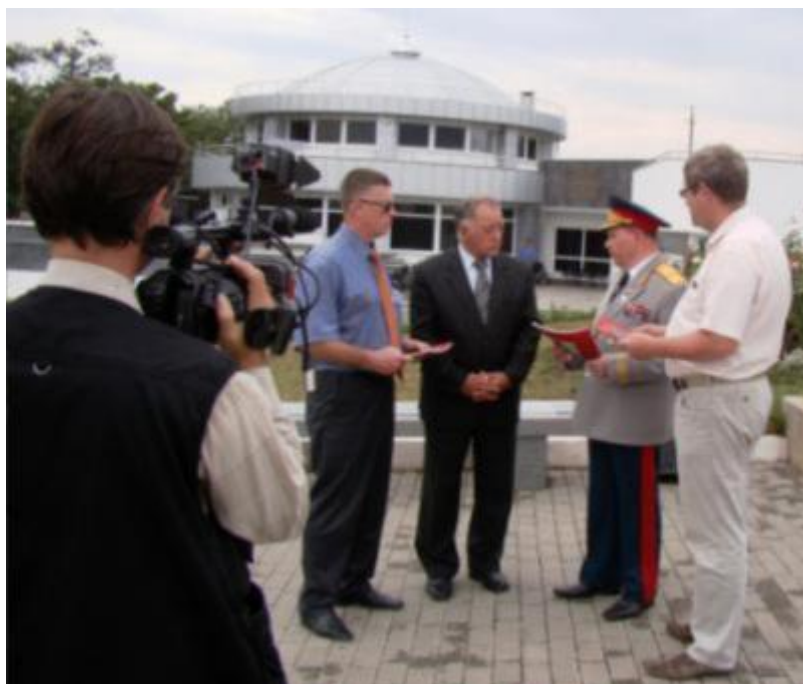
Съемки документального фильма «Нет уз святее братства» телеканалом «Мир Белогорья» (г. Харьков, 2011 г.)