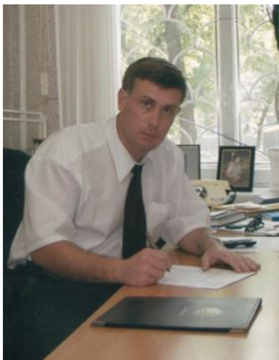
В рабочем кабинете в период службы в органах внутренних дел